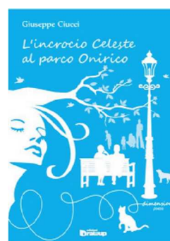
L'incrocio Celeste al parco Onirico, Edizioni DrawUp

Alcune poesie e racconti sono presenti all'interno di varie raccolte, prime tra tutte quelle del gruppo Facebook di Libri Stellariö, pubblicate da Youcanprint: