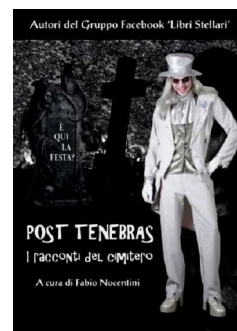
Post Tenebras I racconti del cimitero