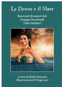
Le Donne e il Mare