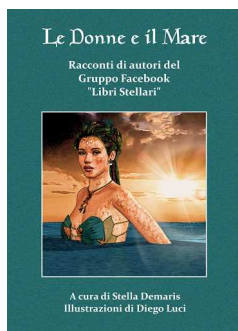
Le Donne e il Mare