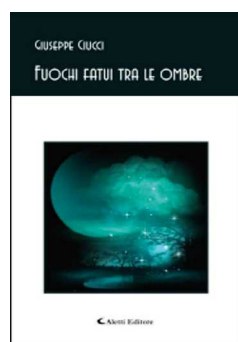
Fuochi Fatui tra le Ombre, Aletti Editore