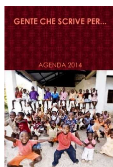
Gente che scrive per... Agenda 2014, Lulu

I libri, alcuni anche in formato e-book, sono disponibili nelle maggiori librerie on line e nei siti degli editori.