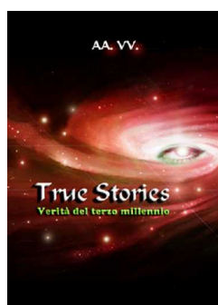
True Stories. Verità del terzo millennio, Lulu