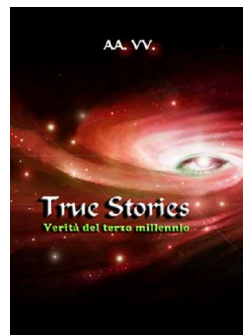
True Stories. Verità del terzo millennio, Lulu