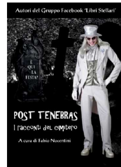
Post Tenebras I racconti del cimitero