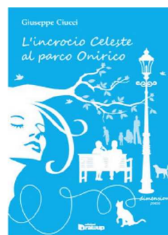
L'incrocio Celeste al parco Onirico, Edizioni DrawUp

Alcune poesie e racconti sono presenti all'interno di varie raccolte, prime tra tutte quelle del gruppo Facebook di Libri Stellari, pubblicate da Youcanprint: