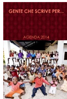
Gente che scrive per... Agenda 2014, Lulu

I libri, alcuni anche in formato e-book, sono disponibili nelle maggiori librerie on line e nei siti degli editori.