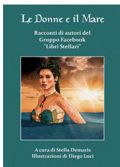
Le Donne e il Mare