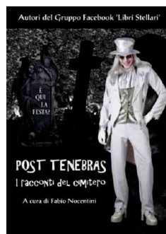
Post Tenebras. I racconti del cimitero

I tre libri, pubblicati da Youcanprint, sono disponibili in e-book (kindle, epub, pdf) e in formato cartaceo nei maggiori siti web; le copie cartacee possono essere ordinate nelle numerose librerie fisiche di tutta Italia convenzionate con Youcanprint.